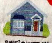
ചെലവ് കുറഞ്ഞ വീട്