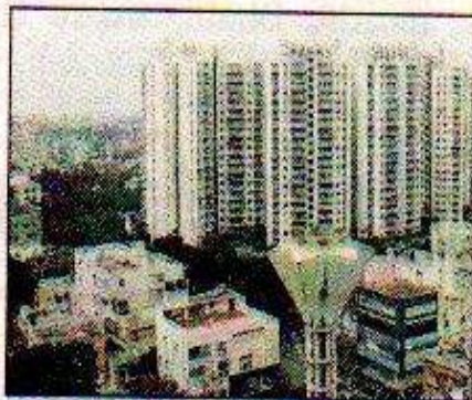
PAYING LESS: Home buyers only need to pay the stamp duty for registration

Tax consultants warned that there may be some price hike in the coming weeks as builders would like to cushion